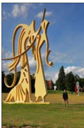
La Princesse et le Dragon