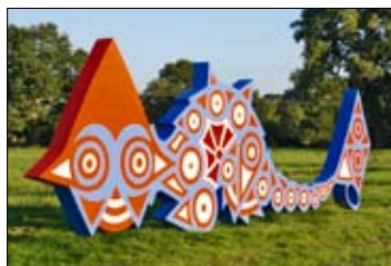
Le Dragon Couché

Ailleurs, voilà des « Guerriers-Fauves Dansants » tenant l'un, un poisson et l'autre, une chaussure. L'allégresse - malgré des blessures béantes - et l'exhibition de leur prise incongrue évoquent comme un triomphe invraisemblable. Pourquoi cette danse joyeuse ? Les images recèlent une explication: le soulier serti d'une flamme, figure un progrès « éclairé » ; le poisson pêché « sous la surface » symbolise notre for intérieur. Ensemble, ils deviennent l'image de la sagesse, s'élevant au-dessus de notre barbarie initiale.