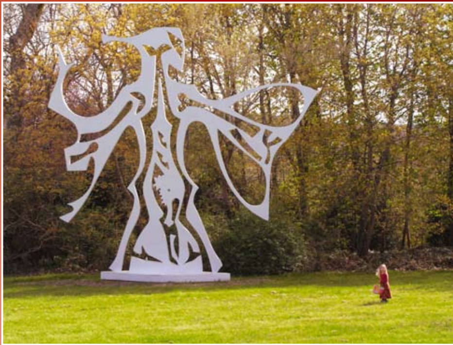
Icare. Les Fougis, 2005. Acier massif, couleur blanche